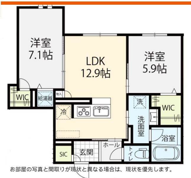
お部屋の写真と間取りが現状と異なる場合は、現状を優先します。