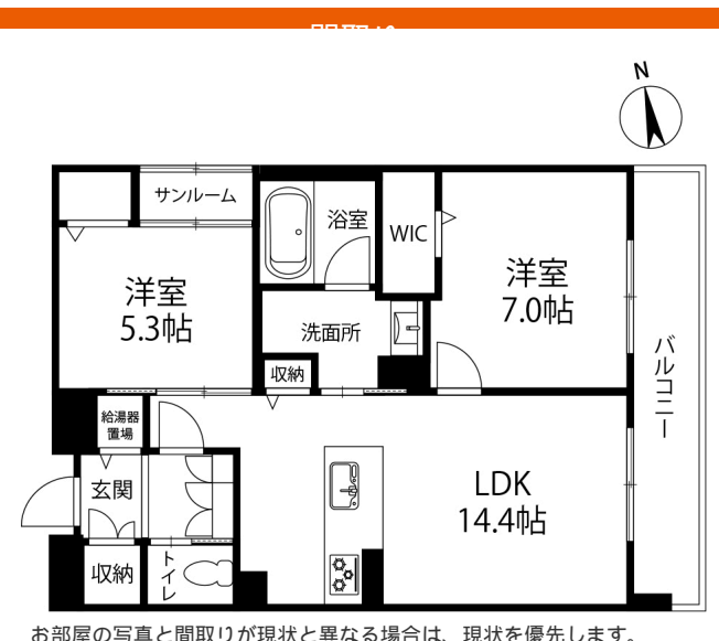
お部屋の写真と間取りが現状と異なる場合は、現状を優先します。