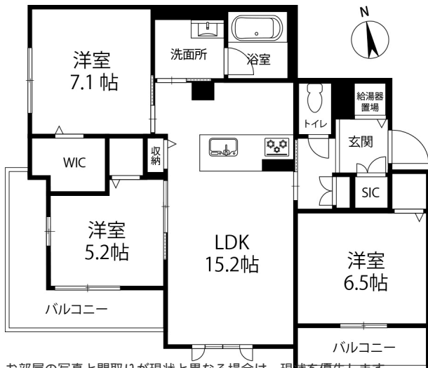
お部屋の写真と間取りが現状と異なる場合は、現状を優先します。