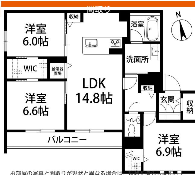
お部屋の写真と間取りが現状と異なる場合は、現状を優先いたします。