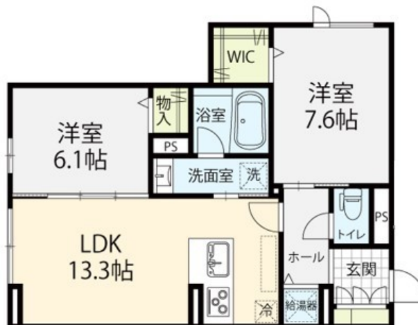
お部屋の写真と間取りが現状と異なる場合は、現状を優先します。