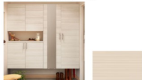
UW/ユニバーホワイト