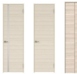
UW/ユニバーホワイト