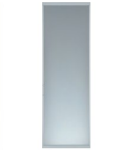
ライトスルースクリーン 1枚樹脂パネル