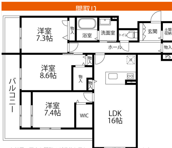
お部屋の写真と間取りが現状と異なる場合は、現状を優先します。